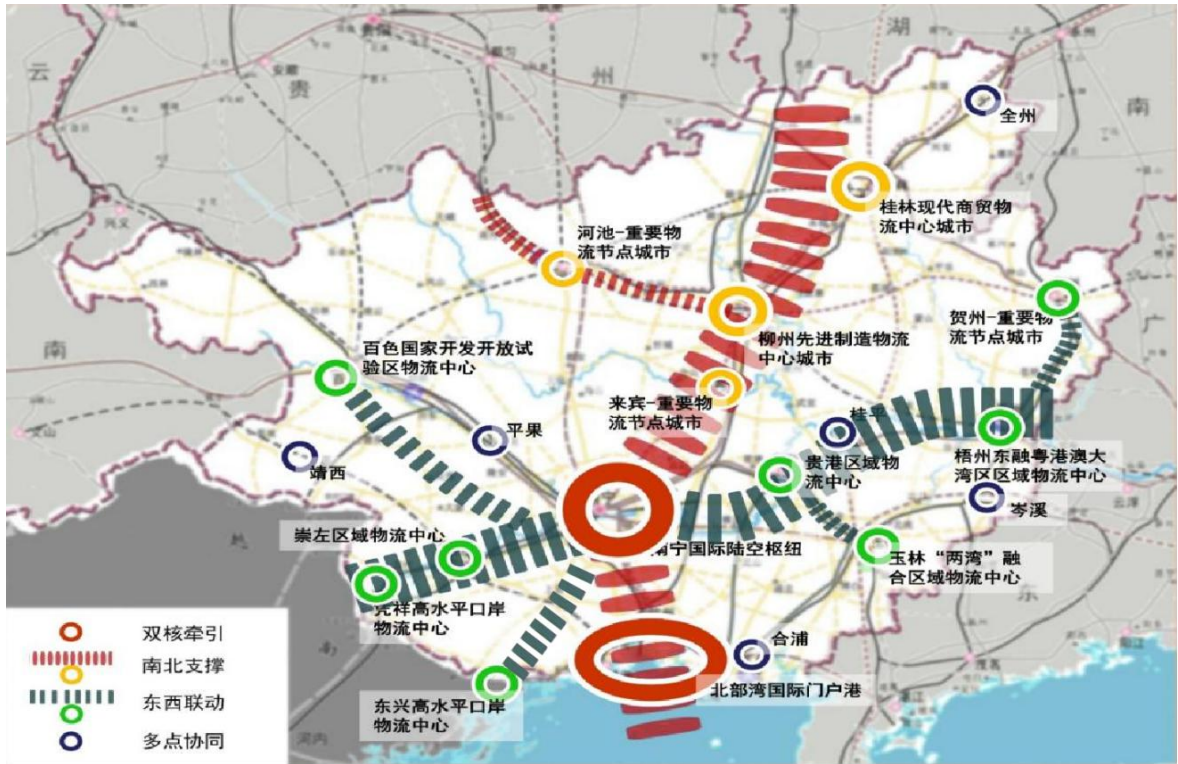
图 1 广西物流空间总体布局