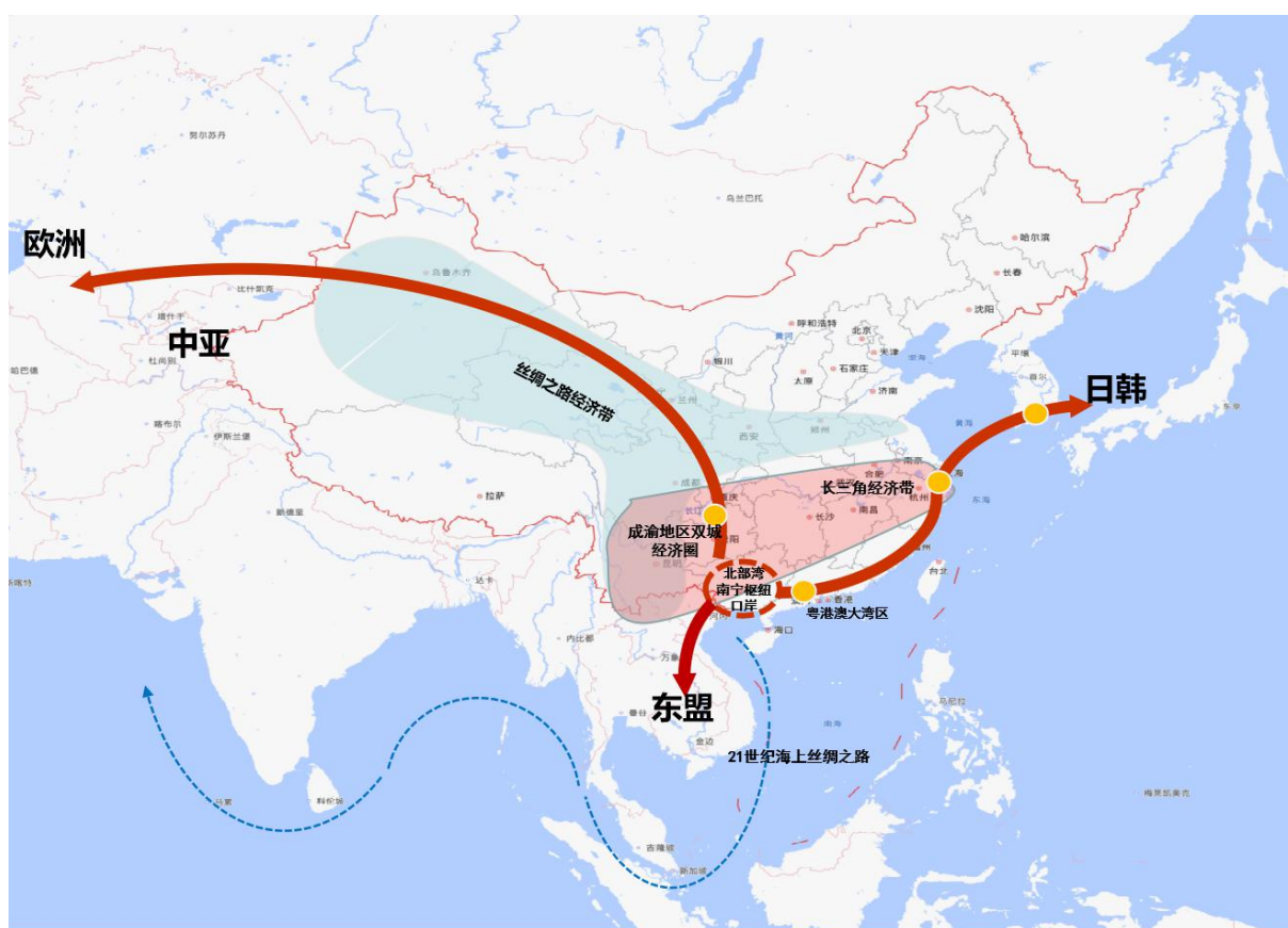
图3 “三向拓展”国际物流大通道

建设西部陆海新通道，构建“三向拓展”国际物流大通道。推动构建向南经北部湾港及凭祥、东兴等沿边口岸至东南亚，向北连通我国成渝、西北地区经中亚至欧洲，向东连通粤港澳大湾区经我国华南、华东地区至日韩的陆海国际海铁联运主通道，加强与 RCEP 其他成员国和欧洲国家合作交流，提升广西在国际产业合作和消费互动中的作用。