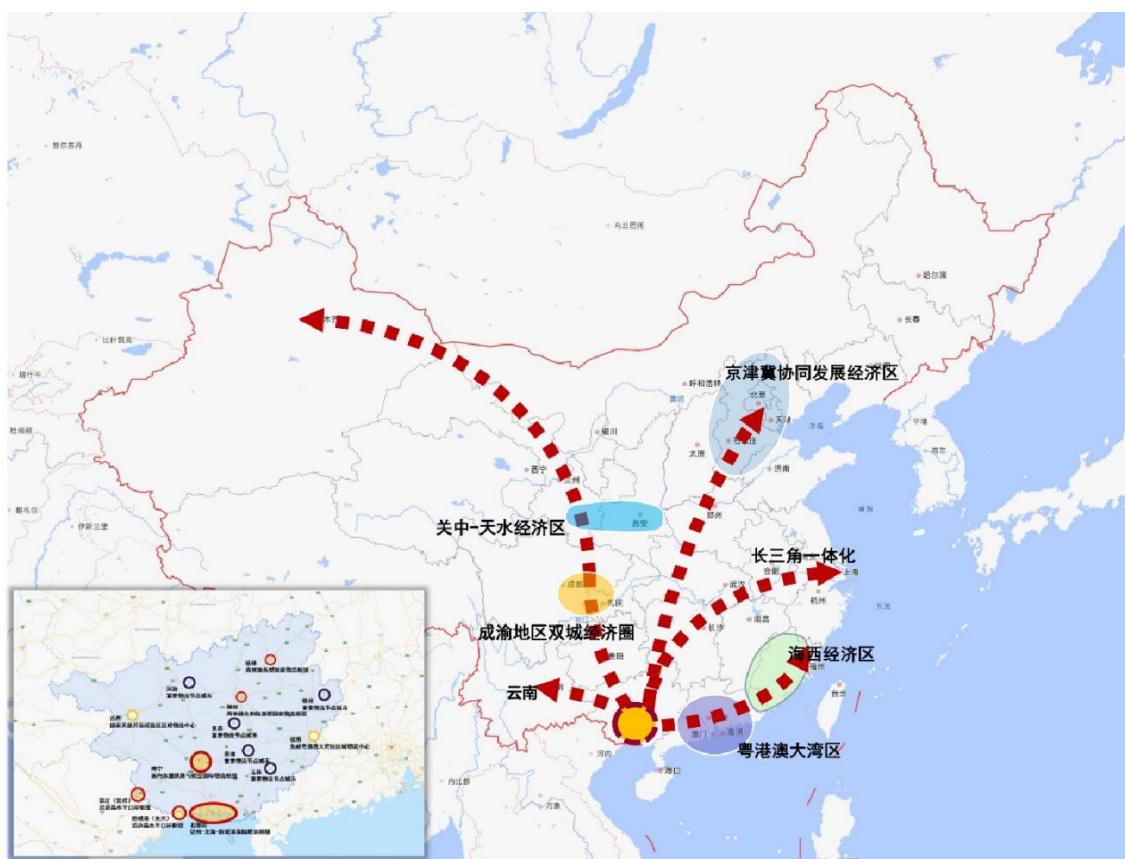
图2 “五向联通”国内物流主通道

完善综合交通网络，打通“五向联通”国内物流主通道。加快物流基础设施建设，贯通广西至粤港澳大湾区向海峡西岸经济区延伸、广西经湖南至长三角地区、广西经华中至京津冀协同发展经济区、广西至成渝地区双城经济圈向关中—天水经济区延伸、广西至云南的“五向联通”国内物流主通道，主动承接东中西产业梯度转移，提升广西在国内区域间产业合作和消费互动中的作用，促进我国经济社会高质量发展。